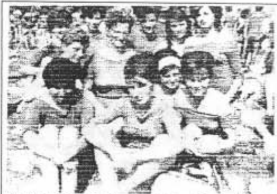
Bild Nr.: 58 - II. Turn- und Sportfest in Leipzig 1963

so erfolgreich in Leipzig operierte, wurde sie 1963 erneut eingeladen (Bild Nr.: 58).