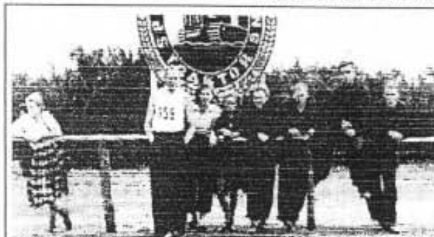
Bild Nr.: 55 - Traktormeisterschaften 1961 in Landsberg, v.l.n.r.:

Anders als beim Turnen war Leichtathletik auch nach 1965 weiterhin ein wichtiger Schwerpunkt in unserem Verein. Insbe-