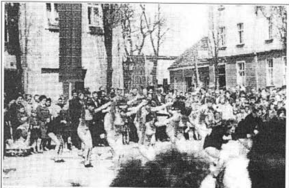
Bild Nr.: 59 - Uraufführung des Programms für das Turn- und Sportfest in Leipzig am 1. Mai 1967 auf dem Marktplatz in Werneuchen

Inzwischen gibt es in Werneuchen zwei ähnliche Gruppe. Zum einen die althergebrachte Gymnastikgruppe von Frau Thäle und zum anderen eine Frauenfitneßgruppe unter Leitung der Sportfreundin Carola